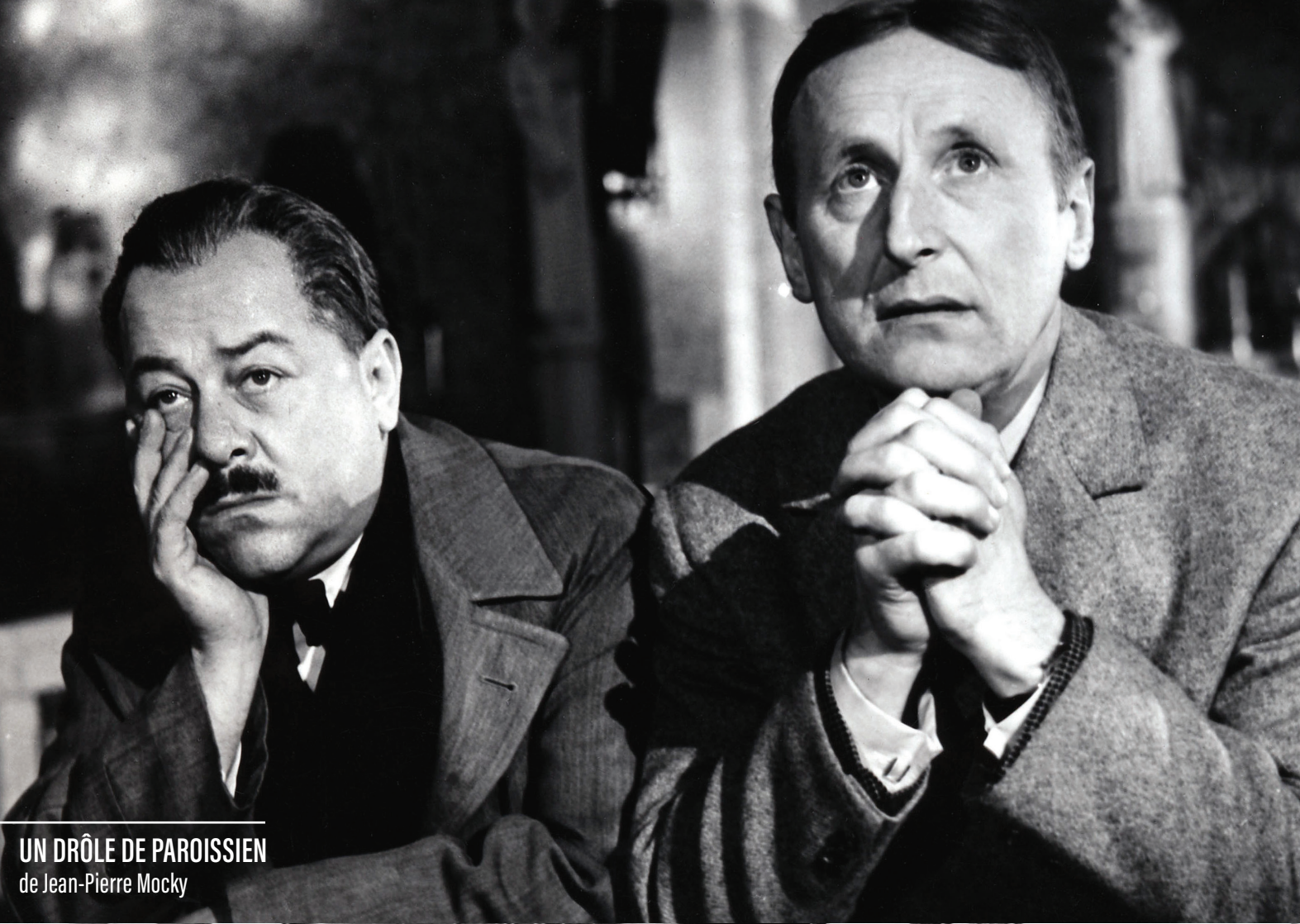
UN DRÔLE DE PAROISSIEN de Jean-Pierre Mocky