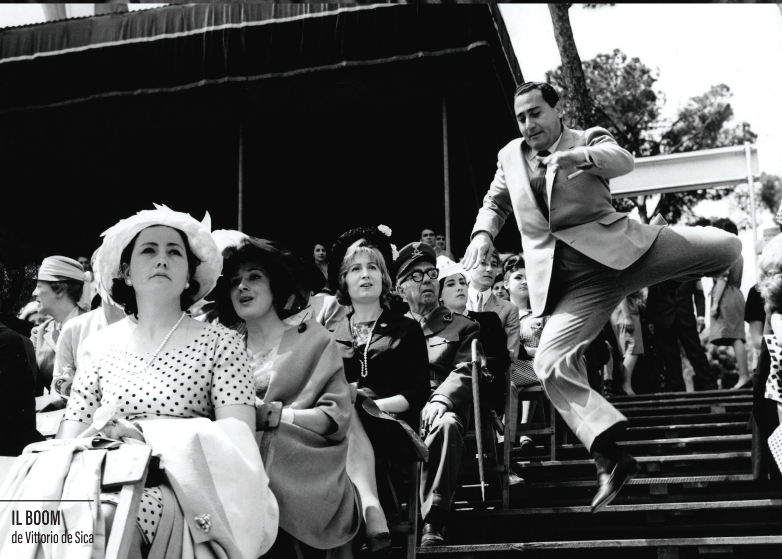
IL BOOM de Vittorio de Sica