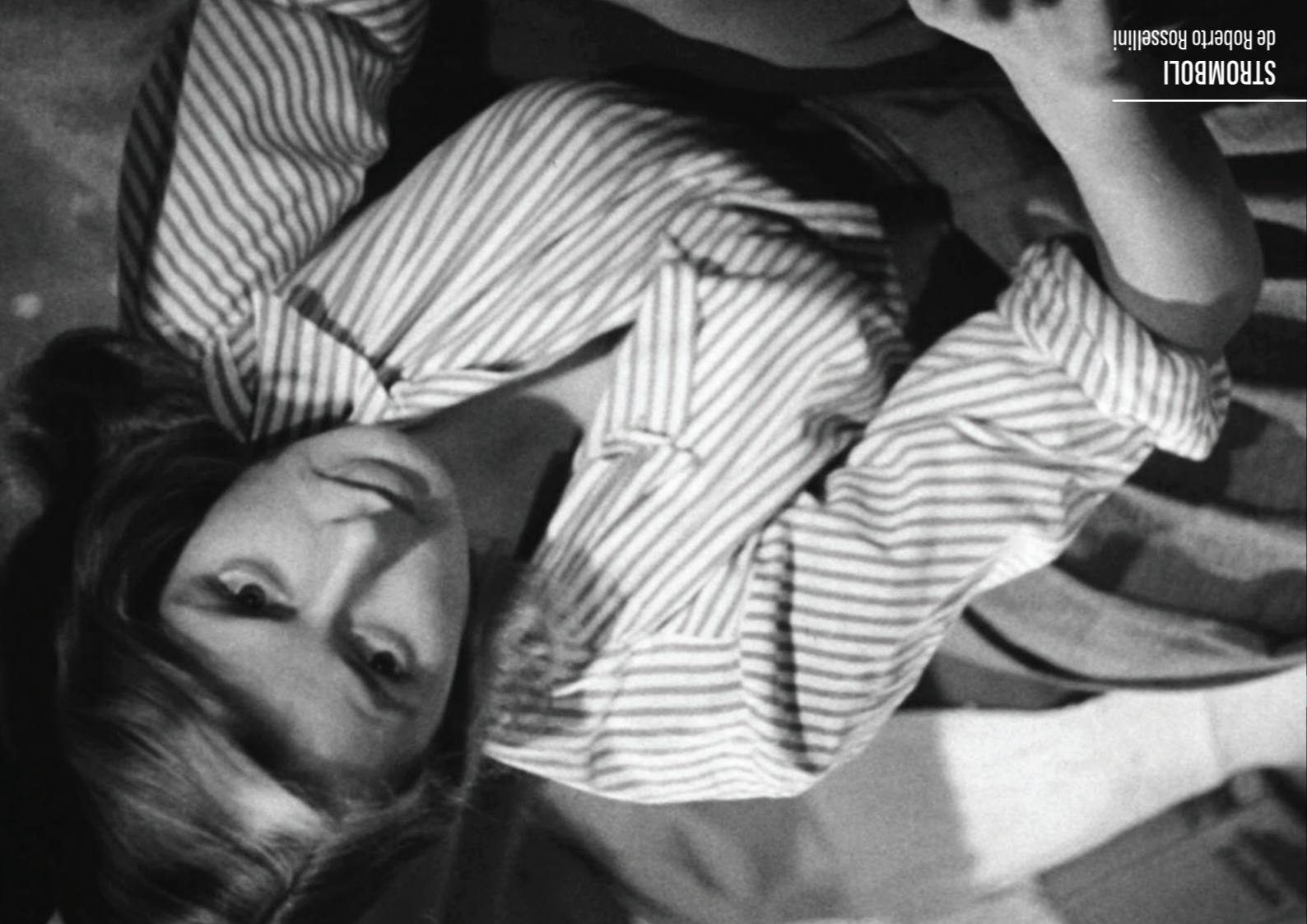
STROMBOLI de Roberto Rossellini