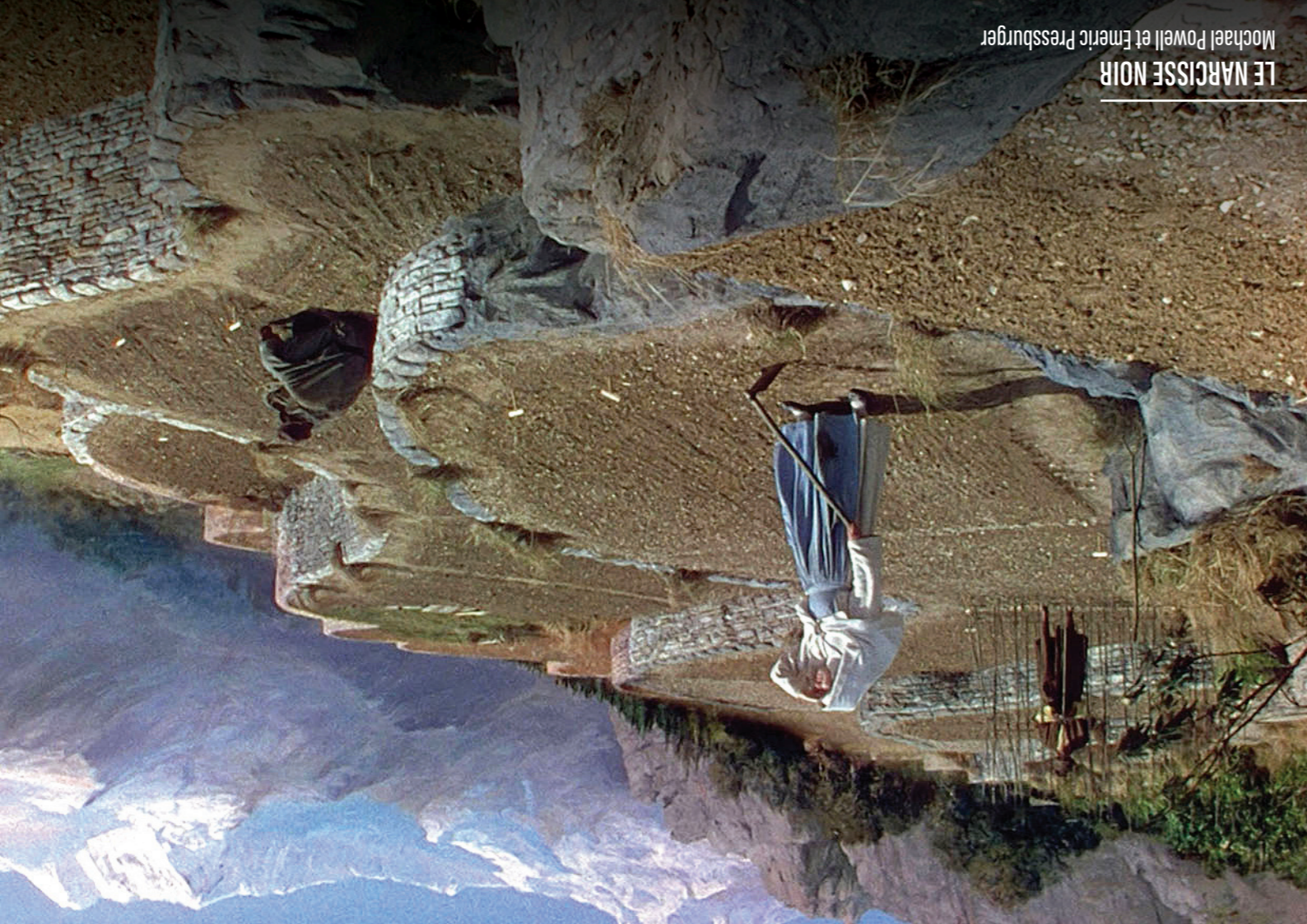
LE NARCISSE NOIR Michael Powell et Emeric Pressburger